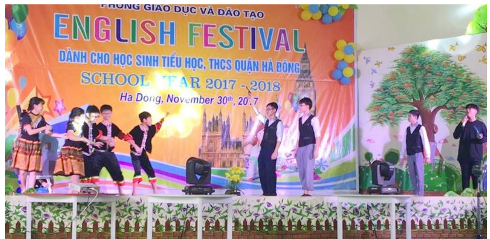
Phần dự thi của THCS Ban Mai

Cuộc thi là cơ hội giúp học sinh thể hiện tài năng, sự hiểu biết, đam mê của mình về môn Tiếng Anh. Điều đó sẽ tiếp thêm động lực để học sinh thấy tự tin hơn khi giao tiếp, tổ chức các hoạt động nhóm, đồng thời luôn tự ý thức: tiếng Anh chính là chìa khóa tri thức quan trọng để các con có thể vững tin hội nhập, đáp ứng xu thế toàn cầu hóa trong tương lai.