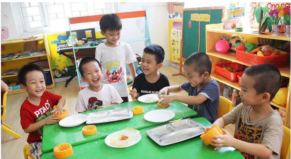
Mỗi ngày tại mầm non Ban Mai là một ngày vui.