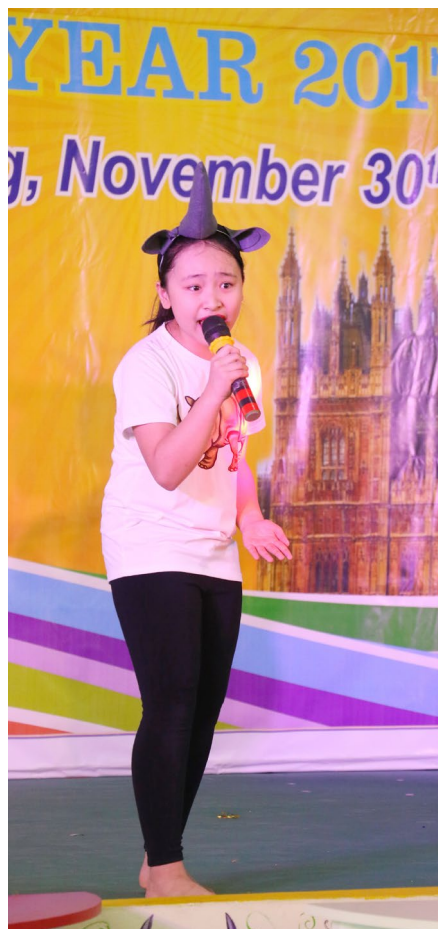
Tiết mục dự thi của các BMSers Tiểu học Ban Mai: "Save the Rhinos" - "What if"

Ngày 30/11, phòng GD-ĐT quận Hà Đông đã tổ chức Festival Tiếng Anh dành cho học sinh Tiểu học và THCS năm học 2017 - 2018. Phần thi của 2 đội học sinh Tiểu học - THCS Ban Mai đã để lại nhiều ấn tượng, mang về 2 giải Nhất từ hội thi.