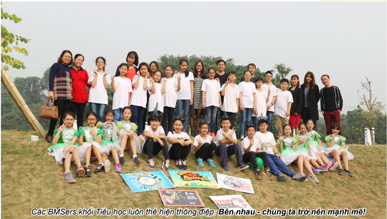
Các BMSers khối Tiểu học luôn thể hiện thông điệp: Bên nhau - chúng ta trở nên mạnh mẽ!

Trường THCS Ban Mai giành giải Nhất với nhạc kịch: Bảo vệ rừng. Với những tình huống diễn xuất sinh động, hùng biện bằng tiếng Anh trôi chảy, tự tin, đội thi đã thuyết phục được Ban Giám khảo và nhận được sự cổ vũ nhiệt tình từ phía khán giả. Thông điệp gửi gắm của các BMSers: Cần chung tay bảo vệ, dừng lại việc chặt phá rừng để xây dựng các nhà máy, các nhà máy thải ra các chất độc hại tàn phá thiên nhiên, tàn phá môi trường sinh thái, tàn phá môi trường sống của con người.