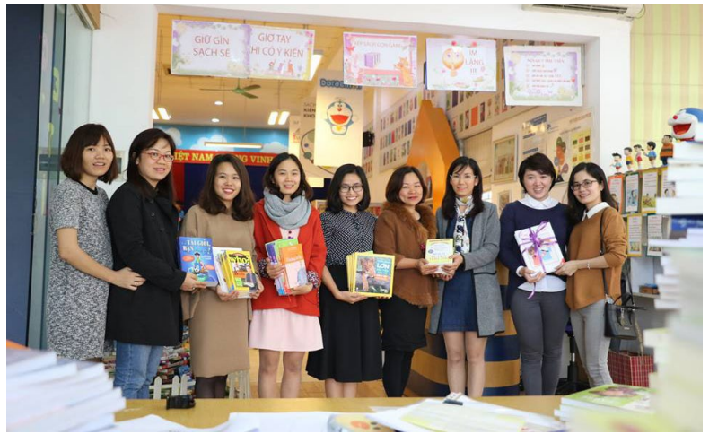
Đại diện Ban PHHS tặng sách cho các lớp khối Tiểu học

*Sáng ngày 19/12, các BMSers đã có chuyến tham quan, học tập tại Học viện chính trị - Bộ quốc Phòng nhân dịp 73 năm ngày thành lập Quân đội nhân dân Việt Nam. Đây là chuyến đi thực sự ý nghĩa và nhiều cảm xúc đối với các con học sinh, bởi lẽ các con được trải nghiệm trực tiếp trong môi trường học tập, huấn luyện, rèn luyện, công tác của cán bộ, chiến sĩ đơn vị - Người lính Bộ đội Cụ Hồ trong thời bình, được thấu hiểu hơn những khó khăn, vất vả của những con người luôn chắc tay súng, vững ý chí, quyết tâm giữ gìn bình yên cho Tổ Quốc.