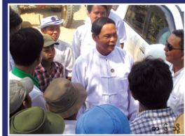
လယ်သမားများ ဥပဒေရေးရာမလုပ်ခြင်းအပေါ် အခွင့်ကောင်းမျှ ခြိမ်းခြောက်၍ ပြေငြိမ်းရေး အကြိမ်ပွဲများဟုဆို