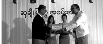
(၅.၅.၂၀၁၃၊ သုတစွယ်စုံစာပေဆုချီးမြှင့် ပွဲ၊ ဆုရရှိသူတစ်ဦး၏ပြန်ကြားကျေးဇူး တင်စကား)

ဒီကနေ့ ဂျ. ၅. ၂၀၁၃ နေ့ မှတ်တင် ယမ်ဟိုတဲးကြီးမှာ ကွပ်ပဉ်လုပ်တဲး သုတစွယ်စုံစာပေ၊ စာပေဆုချီးမြှင့်ပွဲတဲး တြဲဇရာတဲးမြို့ဝှ်ဂှ်မြဲတဲး မြန်မာ ဇရာတဲးမြို့ဝှ်ဂှ်မြဲတဲးဝှ်စုံစုံကြီး ဦးအောင်ကြည်၊ ရန်ကုန်တိုင်းစောသကြီး အစိုးဝှ်စုံစုံကြီးဝှ်စုံစုံစုံစုံစုံစုံစုံစုံ တြဲဇရာတဲးသုတစွယ်စုံစုံစုံစုံစုံစုံစုံစုံ အရာတဲးမြို့များတဲး ယနေ့ဆုရ ခွီသုတ စုံစုံစုံစုံစုံစုံစုံစုံစုံစုံစုံစုံစုံစုံစုံစုံစုံ စုံစုံစုံစုံစုံစုံစုံစုံစုံစုံစုံစုံစုံစုံစုံစုံစုံ မင်္ဂလာဆုတောင်းတဲး တက္ကသိုလ် စိန်တဲးကပြောကြားခွင့်ပြုပါ။