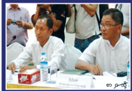
နိုင်ငံရေးအကျဉ်းသားစိစစ်ရေးကော်မတီ အကျဉ်းထောင်များအတွင်း ဝင်ရောက်လေ့လာမည်