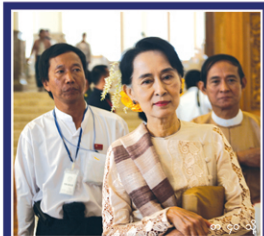
ဒေါ်အောင်ဆန်းစုကြည် သမ္မတလုပ်မည့်ဟုဆိုသည်မှာ အာဇာနည်ရရှိကြောင်းဟုဟုဆို